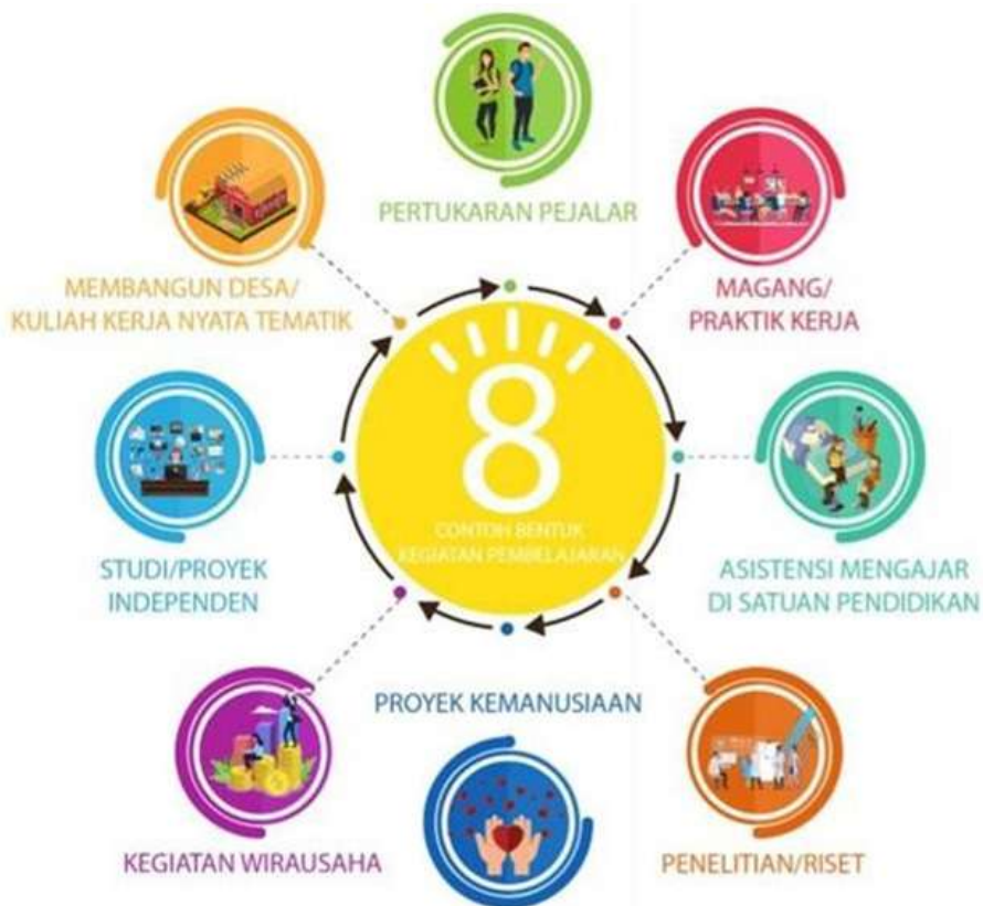
Gambar 3.1 Bentuk Kegiatan Pembelajaran